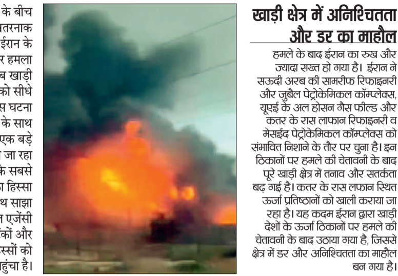
इजरायल ने पार्स गैस फील्ड पर हमला कर दिया।

नाटो ने खींचे हाथ तो होर्मुज के रास्ते पर ट्रंप ने अकेले संमाला मोर्चा गिराया 5000 पाउंड का बम