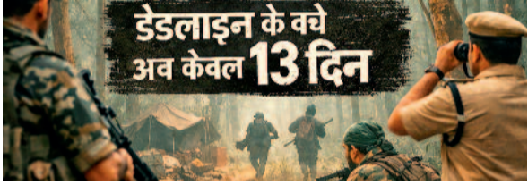
डेडलाइन के बचे अव केवल 13 दिन