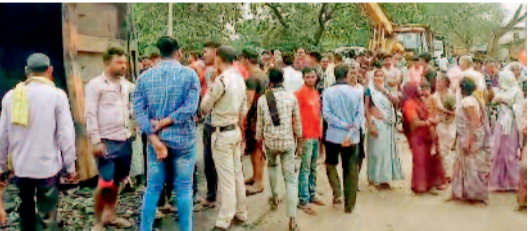
हरिभूमि न्यूज ►► कोरबा

दीपक खदान से कोयला लोड कर पाली की ओर जा रहा एक के तेज रफ्तार ट्रेलर नुनेरा हाई स्कूल के पास अचानक नियंत्रित होकर पलट गया और वहीं सड़क के किनारे खड़े बाइक सवार तीन युवकों को अपनी जद में ले लिया। तीनों युवक ट्रेलर में दब गये जिससे तीनों की मौके पर ही मौत हो गई। हादसे के बाद स्थानीय ग्रामीणों का आक्रोश फूट पड़ा और उन्होंने दीपका पाली मुख्यमार्ग पर चक्काजाम कर दिया। ►►शेष पेज 8 पर