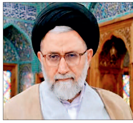
यह कहा इजराइल ने इससे पहले इजरायल के रक्षा मंत्री काटज ने ईरान के इंटेलिजेंस मिनिस्टर इस्माइल खातिब की मौत की जानकारी देते हुए एक बयान में कहा, 'हमारे हमलों की तीव्रता एक नए स्तर पर पहुंच रही है। इजरायल की नीति स्पष्ट है, ईरान में किसी को भी बख्शा नहीं जाएगा, हर कोई निशाने पर है। इजरायल रक्षा बलों ने एक अलग बयान में कहा कि इजरायली वायु सेना ने तेहरान में एक टारगेटेड एयर स्ट्राइक में इस्माइल खातिब को मार गिराया।

इजरायल के हवाई हमले में ईरान के इंटेलिजेंस मिनिस्टर इस्माइल खातिब की मौत हो गई। इससे एक दिन पहले इजरायली हमले में ईरान के सिक्सोरीटी चीफ अली लारिजानी और बासिज पैरामिलिट्री फोर्स के कमांडर गुलामरजा सुलेमानी की भी मौत हो गई थी। इस तरह ईरान ने 24 घंटे के भीतर अपने तीन शीर्ष अधिकारियों को खो दिया है। ईरान के राष्ट्रपति मसूद पेजेरिफिकयान ने सोशल मीडिया प्लेटफॉर्म X पर एक पोस्ट में खातिब की मौत की पुष्टि की। उन्होंने लिखा, 'मेरे प्रिय सहयोगियों इस्माइल खातिब, अली लारिजानी और अजीज नसीरजादेह की कार्यात्मक हत्या, साथ ही उनके परिवार के कुछ सदस्यों और सहयोगियों की शहादत ने हमें गहरे शोक में डुबो दिया है। अमेरिका और इजरायल ने 28 फरवरी की सुबह तेहरान में बमबारी शुरू की थी, जिसमें ईरान के सुप्रीम लीडर अयातुल्ला अली खामेनेई की मौत हो गई थी।