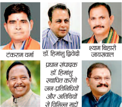
हरिभूमि न्यूज ►► रायपुर